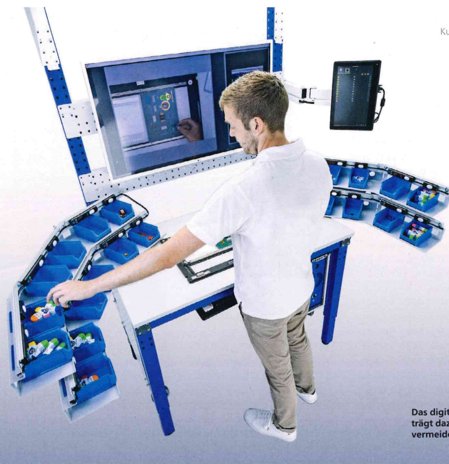
Das digitale Assistenzsystem trägt dazu bei, Montagefehler zu vermeiden und Kosten zu senken.